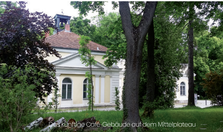
Das künftige Café-Gebäude auf dem Mittelplateau

Helpen Sie mit Ihrer Spende, dass dieses Projekt gelingt!